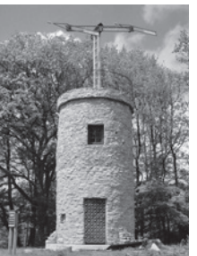
Nachbau einer Telegrafienstation, Nalbach/Saarland

1813 wurde die optische Telegrafienlinie Metz - Mainz eröffnet, eine Verlängerung der Strecke Paris - Metz. Zweck war die behördliche und militärische Kommunikation im französischen Kaiserreich. Die Station in Mainz stand auf dem Drususstein in der Zitadelle.